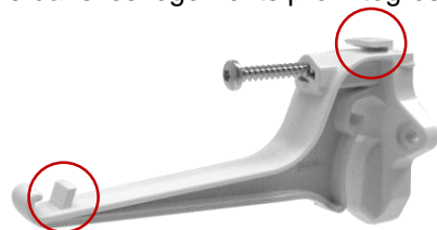
Logements STOPFEUIL pré-intégrés sur le CRONO28